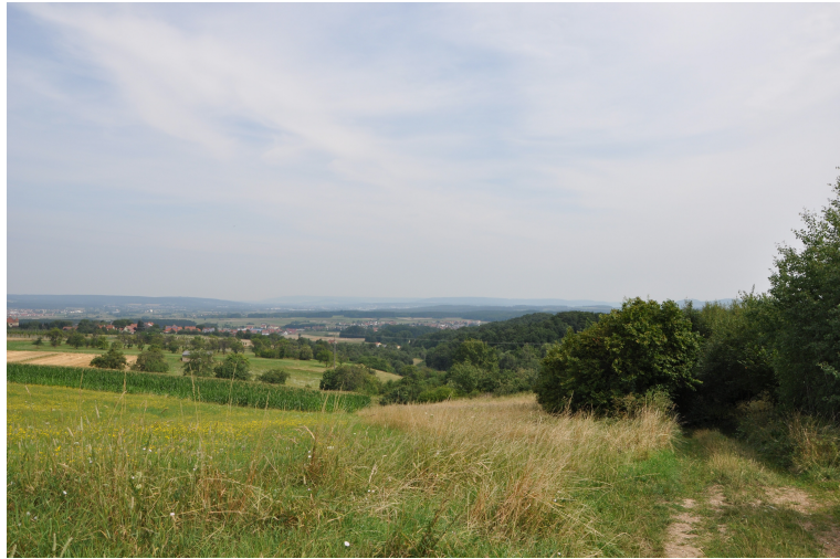
Blick auf Langensendelbach