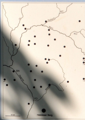
Verbreitung karolingisch-ottonischer Befestigungen in Oberfranken

■ Die Wehranlage wird aufgrund der markanten Konstruktionsweise wohl aus ottonischer Zeit, im 10. Jhdt., stammen. Von dieser Anlage war die durch das Regnitztal verlaufende Nord-Süd-Verbindung zu kontrollieren.