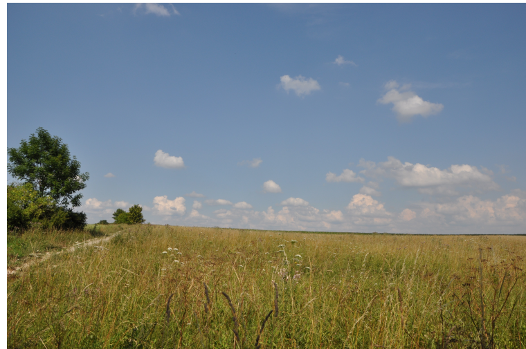
Rundweg auf dem Gipfel